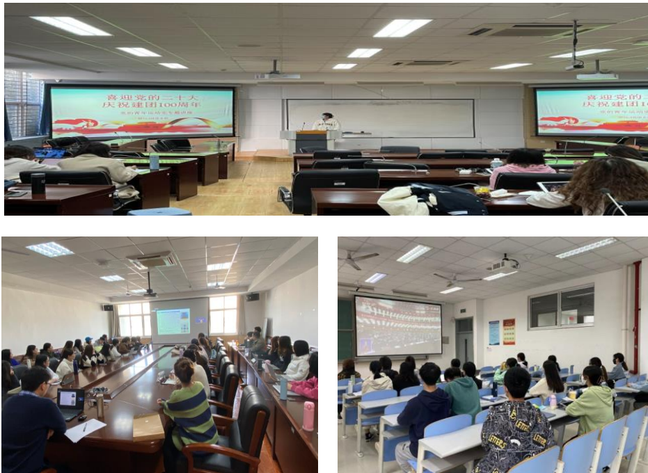
图 2 研究生党建活动剪影