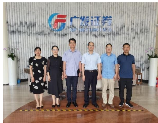
图5 走访联合培养现场导师广发证券总经理徐超平博士