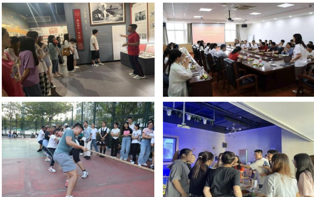
图 3 研究生课余文化活动剪影