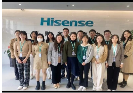
图 6 海信共享中心实习实践