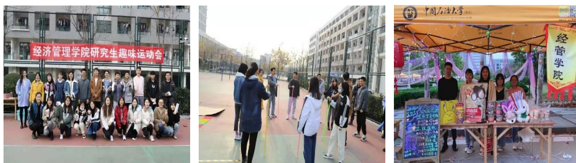
图 3 文体活动

青春逢盛世，奋斗正当时！为了弘扬“全民健身、勇于奋斗”新时代研究生精神风貌，组织了趣味运动会、中秋游园、校园生活心得征文等丰富多彩的文体活动，促进研究生之间的了解，加深同学间友谊、缓解科研压力，丰富我校广大研究生的课余生活。例如，2021 年 11 月 25 日下午举办研究生趣味运动会。趣味运动会以“运动、健康、快乐”为主题，能让参赛者在比赛中感受运动的竞技性，体会运动的趣味性。