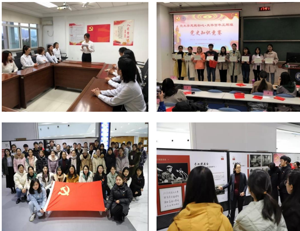
图2 党建与思想政治教育活动

把思想政治工作作为研究生培养的生命线，以深化“三全育人”综合改革为抓手，依托铁人精神教育基地、宣讲团、党史知识竞赛、新时期铁人风采展、重温入党誓词等一系列铁人文化项目，引导师生积极参与铁人文化建设与传播。明确服务国家能源战略的使命和担当，厚植师生爱党、爱校、爱专业的家国情怀。